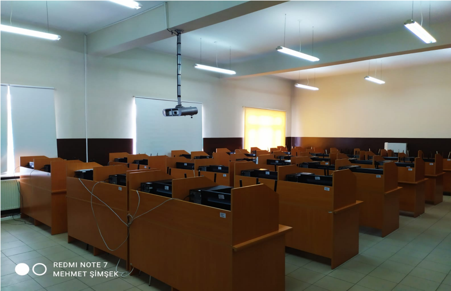
Derslik, laboratuvarlarımız ve kütüphanemiz