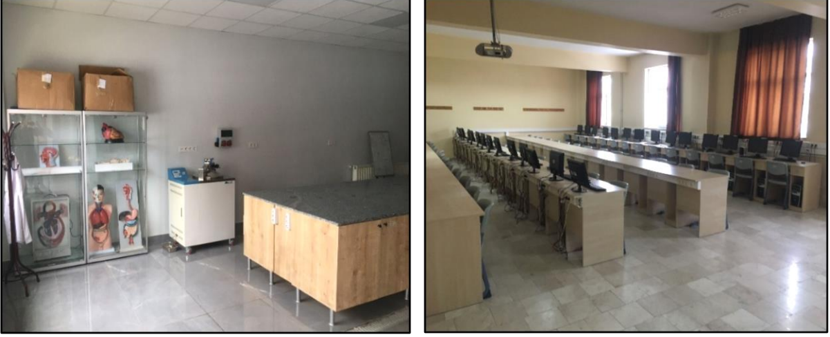
Şekil 2. Dersliklerimiz ve Laboratuvarlarımız