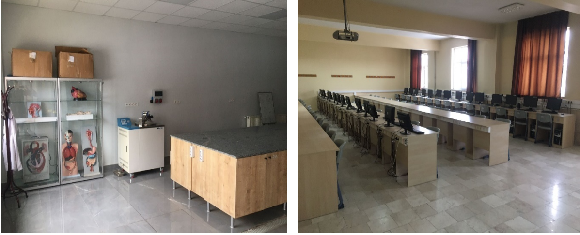
Şekil 2. Dersliklerimiz ve Laboratuvarlarımız