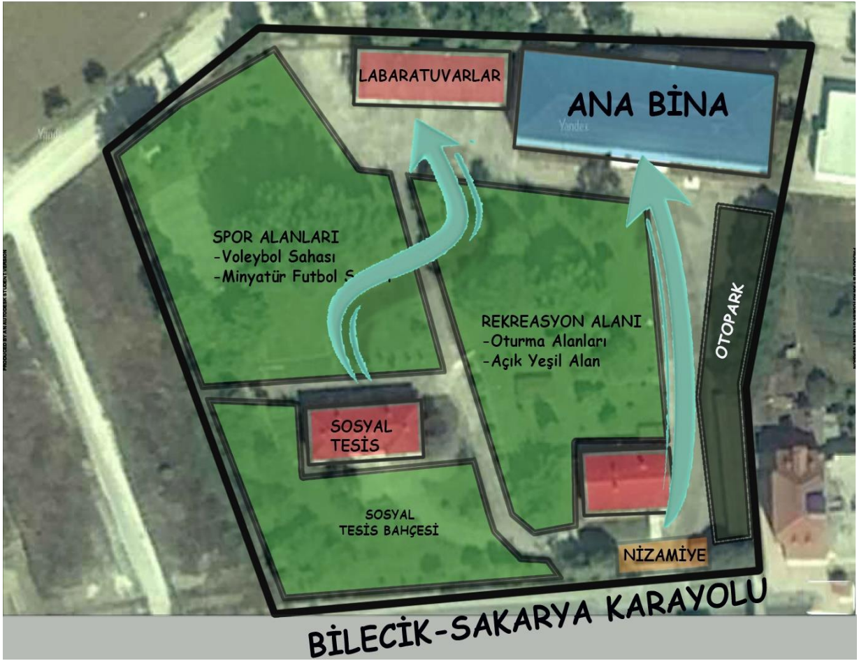
Şekil 1. MYO Yerleşkemiz

Sakarya Uygulamalı Bilimler Üniversitesi Pamukova MYO, Laborant ve Veteriner Sağlık Programı Meslek Yüksekokulundaki yeni programlardan biri olup, 2021 yılında kurulmuştur. Program öğretim elemanı odaları Pamukova MYO merkez binasında yer almaktadır. Laborant ve Veteriner Sağlık Programına ait özel laboratuvarın inşaatı tamamlanmış olup, dersler ve araştırmalar için gerekli malzeme alımı devam etmektedir. Ayrıca okuldaki laboratuvarlarda program öğrencilerinin hizmetine açıktır.